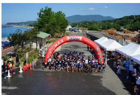
「ちびっこトライアスロン」参加者集合

高知県が高潮対策として平成20年に整備を完了した「奈半利町ふるさと海岸」の利活用を町内で議論するなか「奈半利町みなと未来会議」を設立。同海岸の清掃奉仕活動とともに、地域振興及び交流人口の拡大にも繋がる、小学生を対象とした「ちびっこトライアスロン」を主催している。第1回大会（H22）では参加者が54人であったが、第10回大会（R元）では149人まで拡大するに至った。「ちびっこトライアスロン」は、県内外から多数参加する子ども達や来場する観覧者を気持ちよく迎え入れるという位置づけも相俟って、イベント前には地域住民も積極的な関わりを持ち、清掃奉仕活動の取り組みも意欲的に行われている。