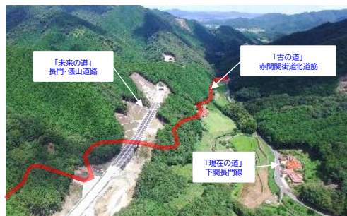
2つの温泉地を繋ぐ3つの街道

古来より温泉及び歴史的にも繋がっている俵山地区と湯本地区で活動する4つの団体が、連携した取組を出来るように平成22年に協議会を設立。2つの地区を繋ぐ古・現在・未来の3街道を地域の宝として、街道整備や文化遺産の継承、生活道路としての環境美化活動、地域間を結ぶ幹線道路を利用した地域連携イベントの開催などに取り組んでいる。限られたメンバーによる地道な活動は、13年目を迎え来訪者や関係人口の拡大などによる地域の活性化や地域の世代を超えた交流の場として機能している。