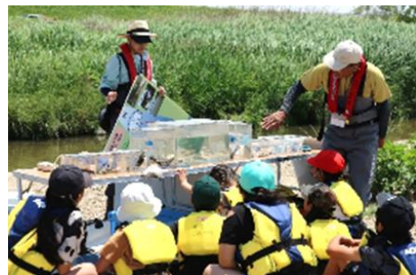
庄内川での環境学習（総合学習支援）