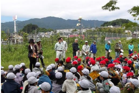
校外学習としての自然観察会

年4回、「おにぐるみの学校」運営委員会を開催し、保全活動（除草・清掃、竹林・倒木の除去）や一般県民、地元小学生を対象に自然観察会を実施。観察会開催のため、自然環境に考慮して散策路等の作成を行っている。観察会への参加者は、広報活動により興味・関心を持たれた方で、大半が初の参加の方であり、参加者同士のコミュニケーションの場となっている。