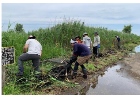
維持管理 (水路内の植生間引き)

漂着ゴミが多く植生帯や生物も減少してきた霞ヶ浦の水辺環境を改善すべく「後世に残そうゴミのない美しい水辺を！」を目標に、清掃活動や水辺環境の保全・再生、啓発活動に取り組んでいる。活動は月2回の草刈り、樹木伐採、清掃活動などの維持管理や生物調査、植生浄化施設の維持管理や環境学習の実施など多岐に渡る。環境学習では魚釣り体験で水質調査を行い、親子で霞ヶ浦の水環境を考える機会を創出。また、水辺で遊ぶ時の注意点や水辺環境の保全等を学ぶことで、再生への理解向上に寄与している。更に、手作りの看板が散歩やサイクリングに訪れた人々の目を楽しませ地域活性化にも寄与している。