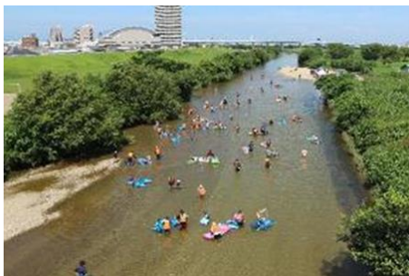
半世紀にわたる活動により改善された矢田川の水質

高度経済成長期に廃液や悪臭・ヘドロ等により「死んだ川」となっていた矢田川・庄内川を「次代の青少年にきれいな水とあたたかい社会を取り戻す」ことを目的に、昭和49年から半世紀にわたり、清掃活動や魚類調査といった子ども達と地域に根差した活動を実施。今では年間約440人の様々な世代の地域住民による活動となる。また設立当初より続けている魚釣り大会や、会独自で整備したビオトープを活用した環境学習を通じて、健全な河川環境の維持への貢献だけでなく、地域コミュニティの形成と地域の環境の魅力づくりを発信し続けている。