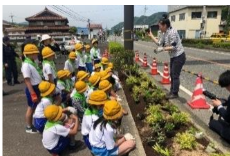
地元住民や小学生と植栽活動を実施

国道29号線沿線の活気を取り戻したいと、各県・各町・人々のつながりを大切にし、地域の魅力発信や、通りたくなる美しい景観のある道にしていこうと同じ思いを持った3人が集まり結成。平成13年より若桜町や八頭町の沿線にセージの花を植える活動を開始し、景観美化活動や沿線の魅力発信マップを作成し配付を行っている。また、平成28年からガードパイプの八頭ブラウンへの塗替などの景観形成活動も行っている。地元小学生や地域の方と一緒に沿線の清掃・花植えや、沿線の歴史を学ぶ街歩きイベントを行うことにより、地域資源の魅力向上や沿線活性化に寄与している。