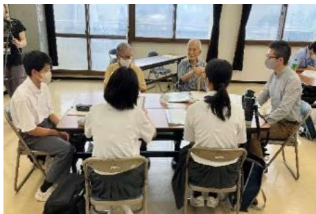
西国街道ボランティア養成講座

かつての西国街道が通っていた井口・鈴が峰地区は開発等により大きく変貌した。まちおこしの一環として、現存する数多くの歴史文化遺産を発掘・修復し、魅力ある町として伝えるべく、平成19年から「西国街道ぶらり旅」等を開始。行政と連携して設置した案内板等を活用するなどして地域の魅力を発信。また、子ども達への伝承活動や中学生ボランティアガイド養成に力を入れている。小中学生に地域の歴史や伝統文化の継承することの大切さを伝えるとともに、郷土愛を培うまちづくりに取り組んでいる。