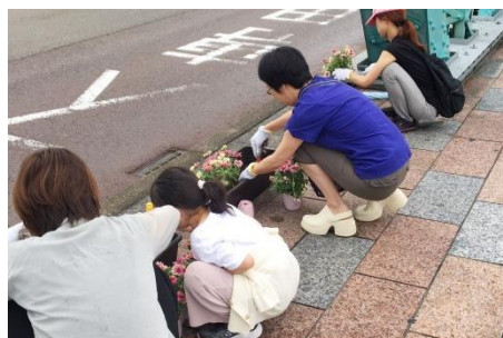
犀川大橋での花植えの様子