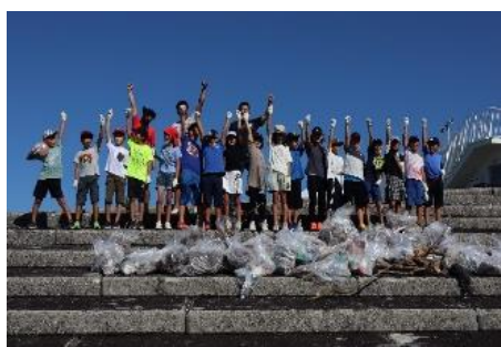
小学生の総合学習による海岸清掃作業