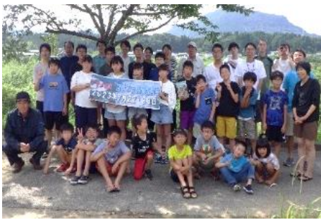
一般公募による一泊二日の夏休み自然環境教室

地元の相知小学校との連携は22年間継続。3年生から6年生を対象に水生生物調査、自然環境観察、学習田での田植え、魚取り等、年間6回120名程度参加の取り組みが学校行事としても定着。令和4年度からは、収穫した米を唐津市を通じて「子供食堂」にも寄贈、令和5年度からは、アザメの瀬を活用した防災教育も開始、地元小学校との交流は地域の活力にもなっている。