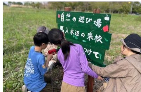
フィールドミュージアムづくり（案内看板の設置）