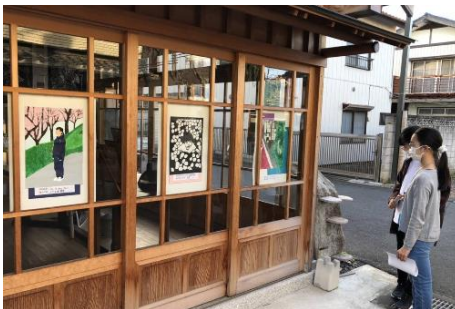
町並みを利用した、まち中美術館

伝統的な建物・町の活気が失われつつある中で、町並み景観を守りながらその特徴を生かして町の活性化を目指す活動として、真壁地区の歴史的建造物や郷土の歴史、伝統的な景観、文化財の特徴などを来街者に案内している。個人所有の建造物でも案内人が所有者に声をかけて内部見学を可能としており、真壁の歴史や文化をより深く理解する機会になるほか、所有者との会話を楽しむこともでき、町に活気や賑わいをもたらしている。また、年2回実施される地元の子供達の作品展では町中の建物に展示された作品を探しながら町全体を歩くことになるため、住民にとっても地域の特徴や魅力を再発見できる機会を創出。