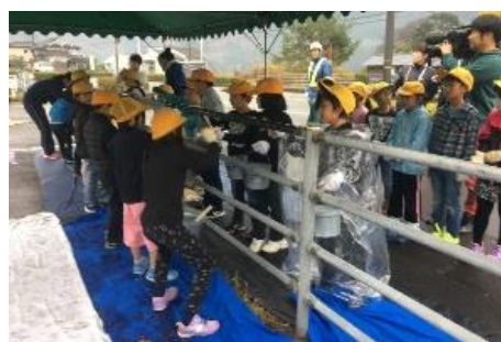
ガードパイプを「八頭ブラウン」へ塗り替え