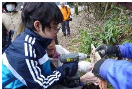
子ども達が制作したウォーキング用案内看板設置 (赤間関街道北道筋の整備)