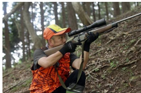
ジビエハンターと行く！リアル狩猟体験&ジビエ堪能ツアー