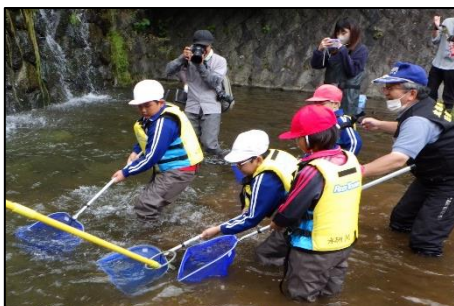
イワナの生態調査

ニッコウイワナは絶滅が危惧され、分布域でも土砂流入により生息環境の消失が進行している。「市民の力で大谷川のニッコウイワナを守ろう！」をテーマに、2019年から市内の研究所、関連行政部局、企業及び小学校等と協働し、ニッコウイワナの生態調査、増殖活動、生息環境保全活動、環境学習などを実施している。環境学習活動では、地元小学生とイワナの調査、土砂を利用したイワナの隠れ家作りを実施し、卵やふ化の様子を家庭の冷蔵庫で観察する機会も提供。さらに成長を見守ったイワナを川へ放流することでイワナの減少原因や環境問題に親子の目が向くよう導くなど、未来の川づくり活動発展へ寄与している。