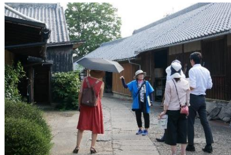
街並み案内（敷地内の建物近くで）