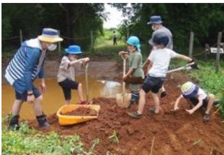
みんなの力で生き物いっぱいの楽校づくり（とんぼ池づくり）

川の自然と触れあえる場づくりを図るため、不法投棄のゴミを処理し自然環境を復元。行政との協働により、馬入水辺の楽校を開校し「子どもが元気、生きもの元気、地域が元気」を合言葉に、「相模川いい川づくり」「川の自然と触れ合える場づくり」「自然体験・環境教育の推進」を3本柱に多様な活動を展開している。市民参加によるフィールドミュージアム（自然生態園）づくり、草刈り等の環境管理活動、年間80回余の環境学習活動、環境保護活動と自然観察を合わせた取組など、子どもたちと自然との触れあい促進に寄与。活動の成果が実り、年々参加者が増加し、地域活性化にも寄与している。