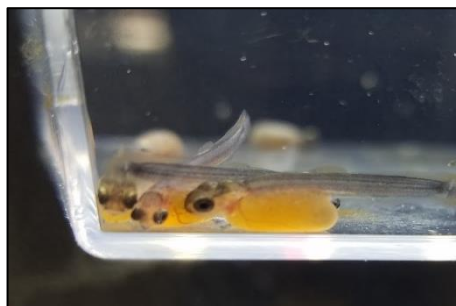
ふ化したイワナの稚魚