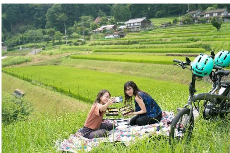
棚田などを巡るe-bikeツアー

観光コンテンツの販売を増やすために、「北色」というHPを作成し、今後も広報活動をより一層取り組んでいく予定である。