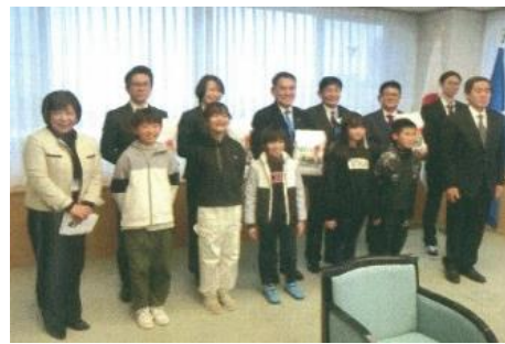
「アザメの瀬」学習田で収穫した米を「子ども食堂」に寄贈