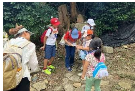
こども西国街道なぞときぶらり旅