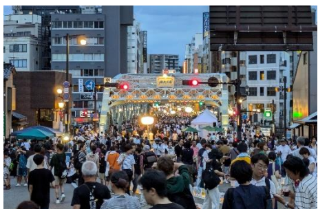
100周年を祝った当日のイベントの様子

犀川大橋は金沢市のシンボルとして親しまれ、令和6年に架橋から100年を迎えた。平成25年から犀川大橋の利活用に取り組む「金沢片町まちづくり会議」は、これまで、犀川大橋の清掃（月1回）や「犀川リバーカフェ」（概ね年5回）、「水辺で乾杯」（年1回）、まちづくり勉強会（概ね年1回）など様々なイベントを継続的に活動。今回、100周年を契機に、より多くの地域の方々に犀川大橋への誇りを持っていただけるよう、当会が祝祭事業運営の一員となり、地域と連携したイベントの提案・活動、花による犀川大橋の装飾、フラッグの作成などを実施。祝祭当日は約15,000人が来場し、シビックプライド醸成の足がかりとなった。